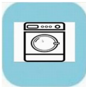
Wassen en drogen