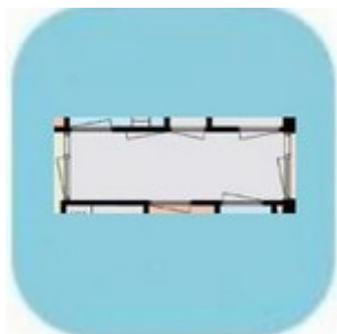
Entree en Hal