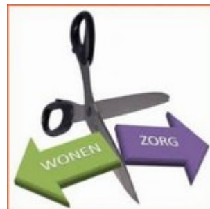
Wonen en Zorg